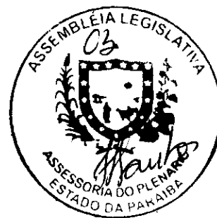
BRUNO CUNHA LIMA DEPUTADO ESTADUAL

Sala das Sessões em 08 de março de 2016.